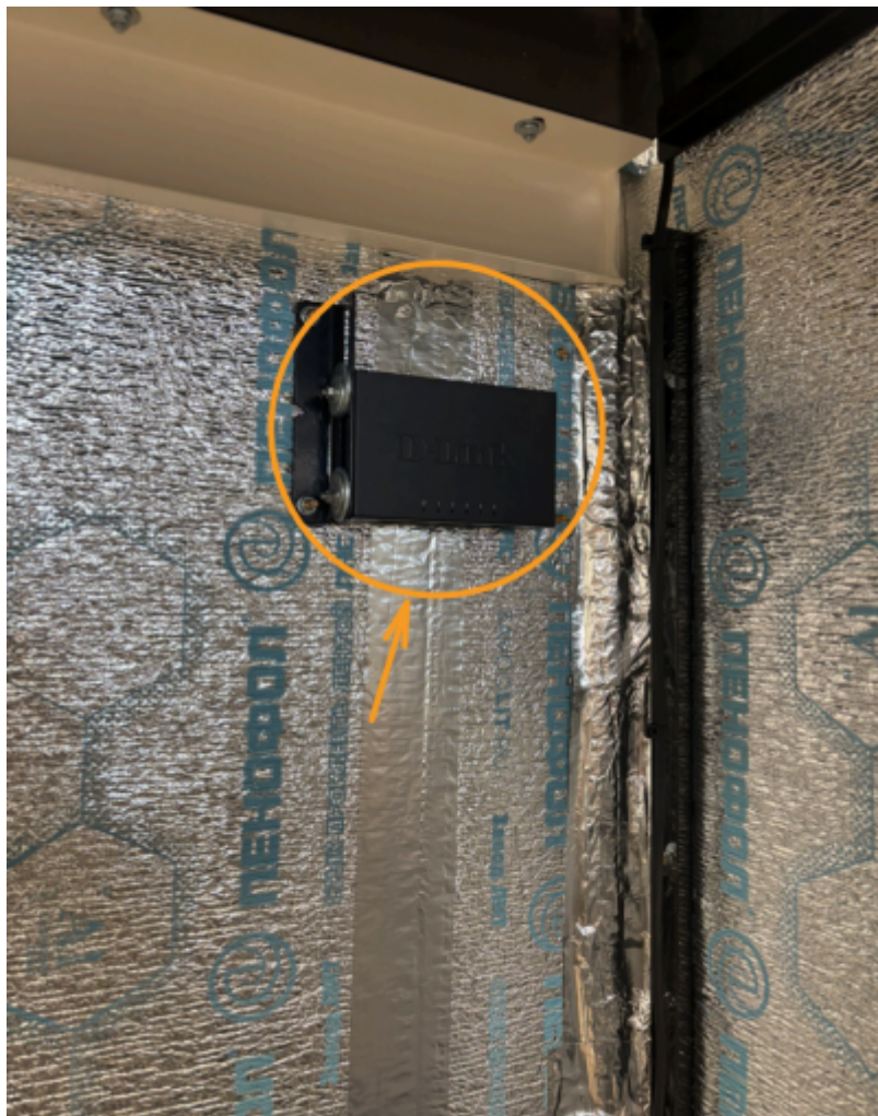
Общий путь кабеля питания идущего в автокассу