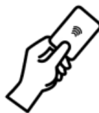
Считайте выданную карту